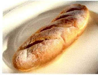
発芽米コパン / 100円

食物繊維やビタミン、ミネラルなどの栄養が豊富な発芽米は、血圧上昇抑制に効果の期待できるGABAも多く含まれています。