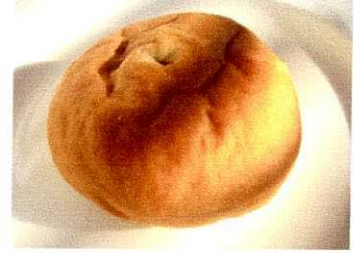
発芽米つぶあんパン / 140円